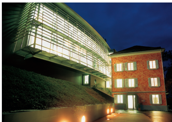
Hauptsitz der DACHCOM in Rheineck

Gesucht wurde eine moderne Systemlösung, durch welche die Erreichbarkeit der Mitarbeitenden und deren Benutzerkomfort beim Kommunizieren erhöht und zentral verwaltet werden konnte. Sie sollte zudem direkt mit der Groupware von Microsoft Exchange kommunizieren und auf die Datenbanken von Exchange zurückgreifen. Der besondere Anspruch: Da DACHCOM über 90% mit Macintosh Systemen arbeitet, musste dies auch zwingend reibungslos für Windows und Mac OS X funktionieren. Im Weiteren sollte die Lösung möglichst zukunftssicher sein und einen späteren Ausbau auf VoIP bieten. Ebenso wurde nach einer Möglichkeit gesucht, Voice Mail zentralisiert zu verwalten. <